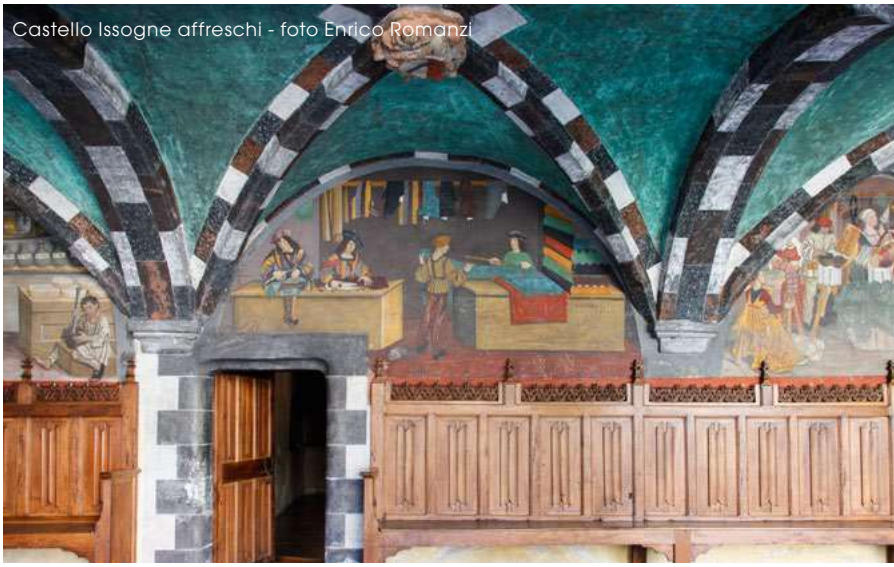
Castello Issogne affreschi