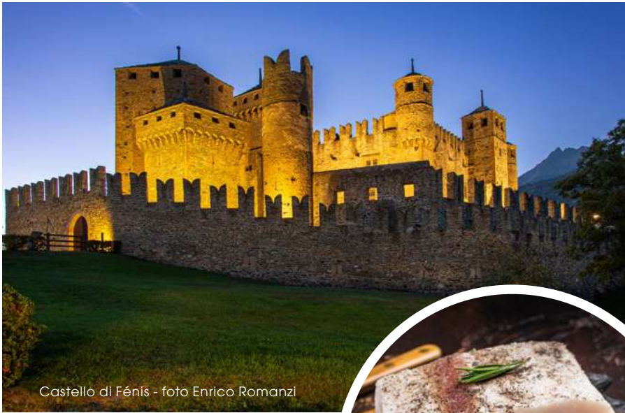
Castello di Fénis