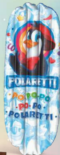
Materassino cm 76x183

scopri come su oppure scansiona il qr code