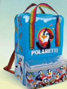
Zaino cm 37x27x10