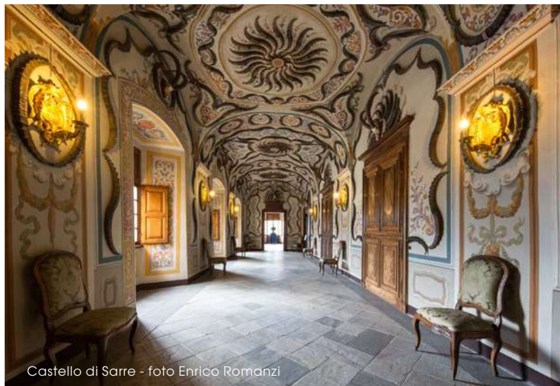
Castello di Sarre

Umberto I di Savoia ne aveva fatto il padiglione di caccia per le battute sul Gran Paradiso , all'epoca riserva venatoria regia e non ancora Parco Nazionale. E la caratteristica principale degli ambienti del castello di Sarre, soprattutto il corridoio e il grande salone dei trofei, al primo piano, è proprio questa: la decorazione realizzata con le corna degli stambecchi e dei camosci abbattuti. Un gusto che oggi appare un po' macabro, ma che rispondeva alla (non certo acuta) "sensibilità ecologica" dell'epoca. Sarre conosce il suo apogeo con la moglie di Umberto II, Maria José, che ne fa la base per le sue imprese sportive. Ed ecco infatti, in una interessante galleria fotografica nei saloni del pianterreno, la principessa con gli sci, in tenuta da arrampicata, con i figli per la merenda sotto la pergola del giardino e così via. La dimensione domestica, quasi "borghese", della vita privata di una casa regnante. Il tour storico-gastronomico può a sua volta concludersi nella vicina Aymavilles con lo shopping all' Azienda Agricola Les Cretes ( www.lescrettes.it ). Un viaggio sensoriale con degustazioni dei magnifici vini della valle. Per un brindisi alla salute... dell'Italia repubblicana.