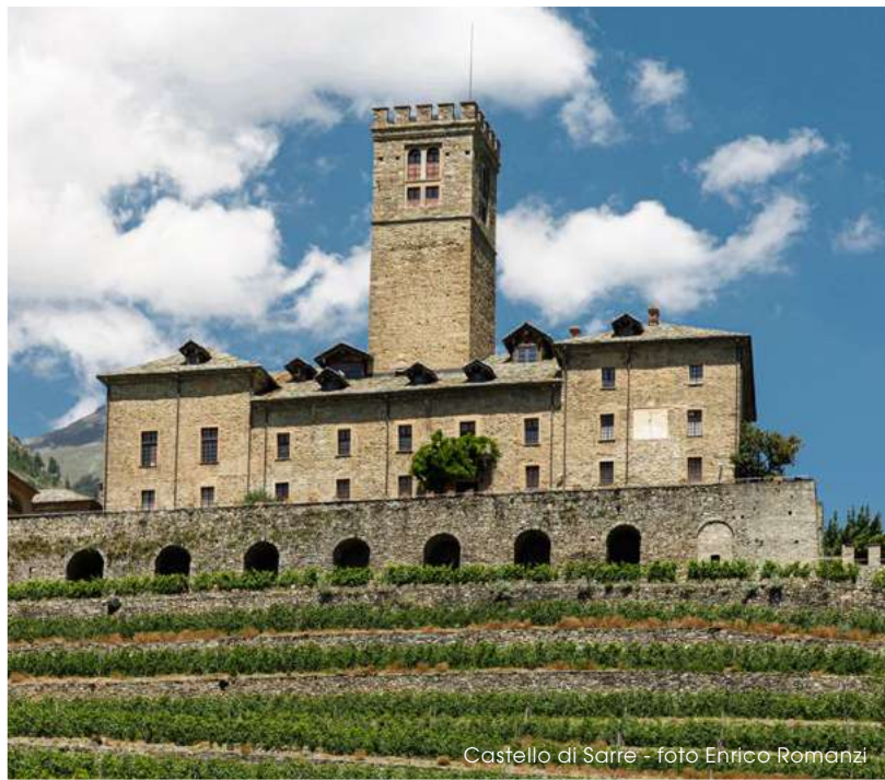
Castello di Sarre