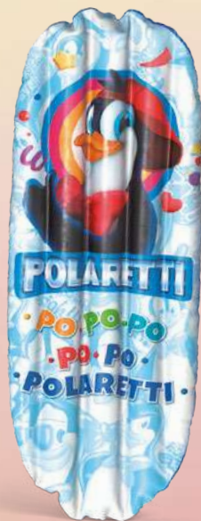
Materassino cm 76x183