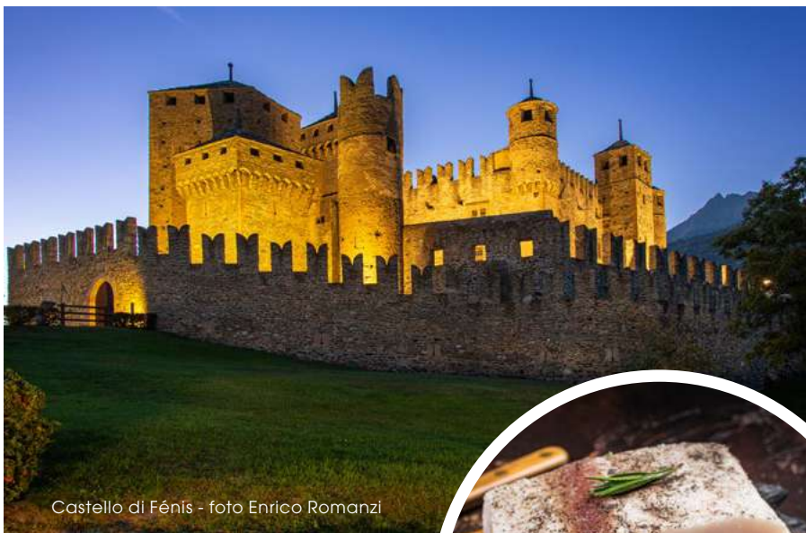
Castello di Fénis