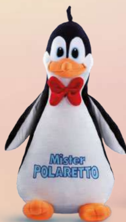
Maxi Peluche H. cm 55