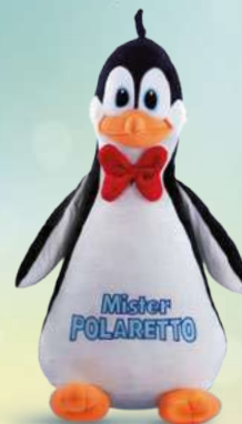
Maxi Peluche H. cm 55