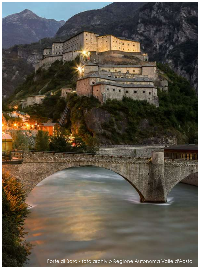
Forte di Bard - foto archivio Regione Autonoma Valle d'Aosta

U n tempo, avere le chiavi della Valle d'Aosta significava avere le chiavi dell'Italia. Ed è per questo che la valle è disseminata di castelli, forti, fortezze e altre strutture militari: per controllare (o impedire) il transito di carovane ed eserciti e per riscuotere i pedaggi. Ma col passare dei secoli alcuni di questi edifici hanno cambiato scopo, si sono, per così dire, ingentiliti. Sono diventati dimore signorili, case di caccia o di soggiorno per nobili e sovrani.