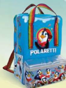
Zaino cm 37x27x10