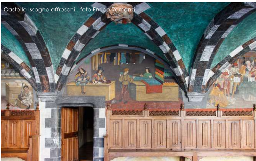
Castello Issogne affreschi