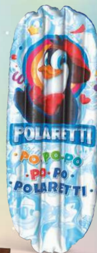
Materassino cm 76x183