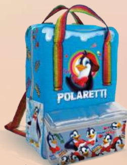
Zaino cm 37x27x10