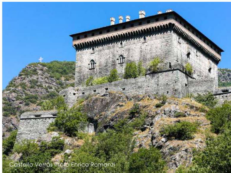
Castello Verràs