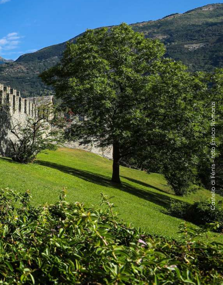
Castello di Fénis